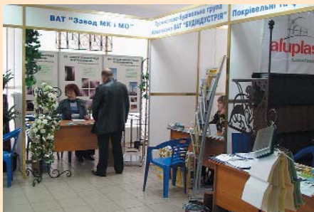
Виставка «Сучасний дім»