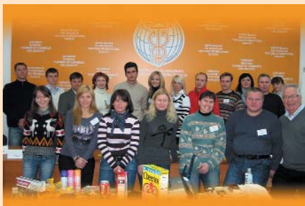
Група слухачів семінару «Принципи ефективного маркетингу»