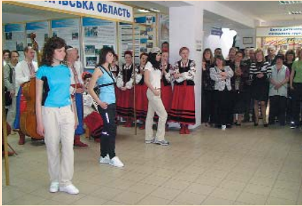
Демонстрація моделей спортивного одягу на виставці «Чернівецьчина туристична»