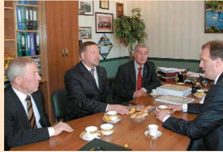
Зустріч керівництва Миколаївської, Чернігівської та ТПП України в Миколаївській ТПП

29–30 січня 2009 року Дипломатична академія України при МЗС України провела дводенний семінар «Торговельно-економічне співробітництво областей України з країнами Західної Європи та Північної Америки» за участю представників регіональних торгово-промислових палат України. Семінар був організований в рамках проекту «Сприяння глобальній інтеграції України» за підтримки