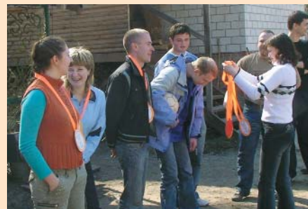
Урочисте нагородження переможців

Сильна команда Чернігівської ТПП, в якій активність молодих спеціалістів підтримується професійністю досвідчених робітників, долає випробування, що ставить перед нами сучасне життя, досягає успіхів та знаходить нові шляхи та напрямки діяльності. Спільний відпочинок сприяє зміцненню колективу, взаєморозумінню, встановленню добрих стосунків між колегами, що, в свою чергу, покращує загальну атмосферу і колективний дух співробітників Палати.