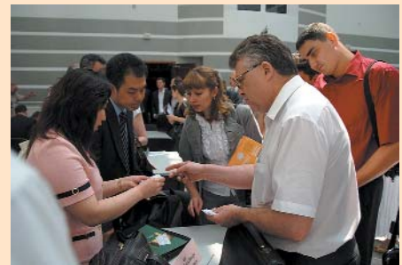
Під час переговорів на українсько-китайському форумі в ТПП України

для наших підприємців доступ до країн всього Балканського регіону. У попередніх планах організаторів міжурядової комісії — організація наступного засідання Міжурядової українсько-македонської комісії з питань торгівельно-економічного співробітництва, яка відбудеться в Чернігові. 13 червня 2009 Чернігівську область та Чернігівську торгово-промислову палату відвідала офіційна делегація Надзвичайних і Повноважних Послів, почесних консулів іноземних держав і дипломатів з 15-ти країн світу: Азербайджану, Киргизії, Лівану, Палестини, Естонії, Норвегії, В'єтнаму, Угорщини, Китаю, Нігерії, Кореї, Грузії, Молдови, Мексики, Кувейту . Метою візиту почесних гостей було ознайомлення з туристичним потенціалом та інвестиційною привабливістю області, розширення співпраці, поглиблення торгівельно-економічних зв'язків, обмін інформацією, укладення ділових контактів. На іноземних послів чекав щирий прийом, організований Чернігівською торгово-промисловою палатою. Ділова частина заходу включала в себе прес-конференцію для місцевих ЗМІ та презентацію, на якій виступили заступник міністра іноземних справ України