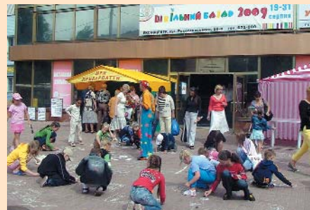
Дитячі конкурси на виставці «Шкільний базар»