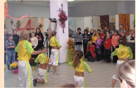
Учасники Дитячого обласного конкурсу фітодизайну «Осінні барви»

виставку й гості з-за кордону — Білорусі. Представив свої туристичні можливості на виставці й Національний архітектурно-історичний заповідник «Чернігів стародавній». Науковці установи щороку відвідують різноманітні туристичні форуми у Києві та інших містах України. Пропагують туристичні маршрути та унікальні пам'ятки архітектури міста і в засобах масової інформації. Відповідно, щороку зростає кількість відвідувачів музейних експозицій заповідника «Чернігів стародавній».