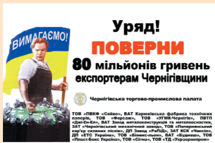
Макет білборду з вимогою повернути заборгований ПДВ

Позитивні результати такої всебічної співпраці підтверджують статус Чернігівської ТПП як надійного партнера ділової спільноти регіону та спонукають підприємців до участі в ТПП.