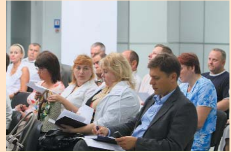
Засідання експортерів Чернігівщини в Чернігівській ТПП з питання невідшкодування ПДВ

приємств та розповів про можливості, які надаються учасникам проекту в пошуках партнерів та технічній підтримці в установленні ділових відносин зі швейцарськими підприємствами. Учасниками зустрічі стали 10 підприємств — членів Палати: ПВТП «Джі-Ен-Ел», ЗАТ «Чернігівський механічний завод», ТОВ «ДЕДАЛ», ВАТ Продовольча компанія «Ясен», ЗАТ «КСК «Чексіл», ТОВ Компанія «Спорттехніка», НВО «МАГР», ТОВ «ТАН», ЗАТ «Чернігівська фабрика лозових виробів», ТОВ «Датчикове підприємство «Завод РАПІД».