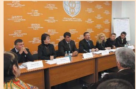
Прес-конференція з Чернігівським прес-клубом реформ

Результатом зустрічі було підписання Резолюції зборів експортерів Чернігівщини до Уряду України з вимогою виконання Закону України «Про податок на додану вартість» (Закон ВР України від 03.04.1997, № 168/97-ВР «Про податок на додану вартість») та відшкодування перевіреного та простроченого ПДВ експортерам Чернігівщини у повному обсязі у встановлені терміни. Також було прийнято рішення про створення робочої групи, основним завданням якої є відстояти законні права підприємств експортерів та добитися відшкодування їм податку на додану вартість.