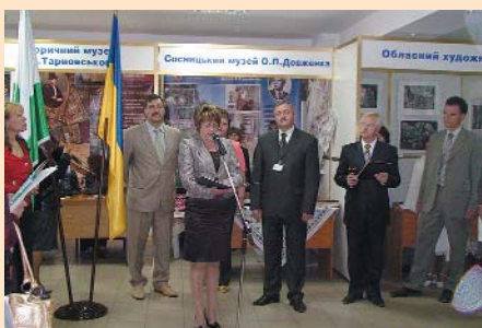
Заступник губернатора Н. Білоус відкриває виставку «Чернігівщина туристична»