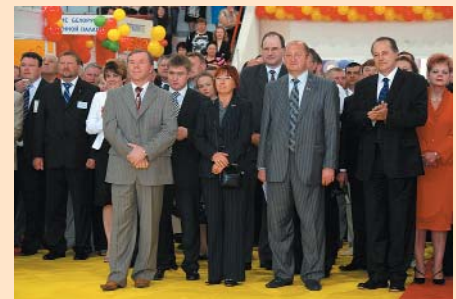
Генеральний директор Гомельського відділення БілТПП та гості виставки «Весна в Гомелі 2009» під час урочистого відкриття