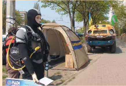
Експозиція виставки «Чернівецьчина туристична»