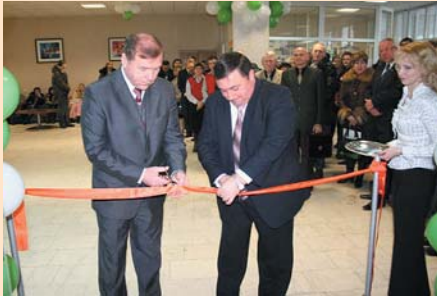
Відкриття Третньої спеціалізованої будівельної виставки «Строим дом» в Гомелі