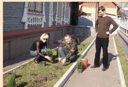
Озеленення території головного офісу Чернігівської ТПП