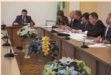
Нарада в Чернігівській ОДА з питань відшкодування ПДВ експортерам