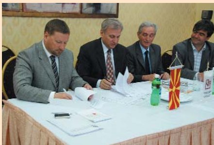
Під час підписання угоди про співробітництво між Чернігівською ТПП та промисловою палатою м. Бітола (Македонія)