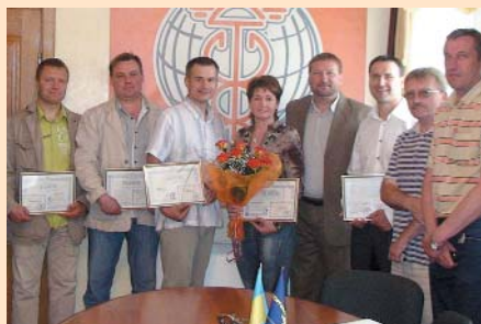
Урочистий прийом підприємців в члени Чернігівської ТПП