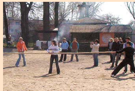
Святкування 14 річниці заснування Чернігівської ТПП

фахівців, здатних виконувати покладені на них функції в умовах ринкової економіки, підвищувати роль Палати у системі економічних, науково-технічних і торгових зв'язків.