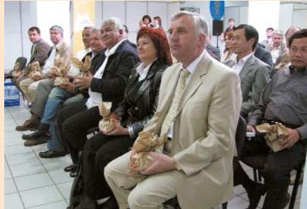
Делегація Надзвичайних і Повноважних Послів, почесних консулів іноземних держав і дипломатів