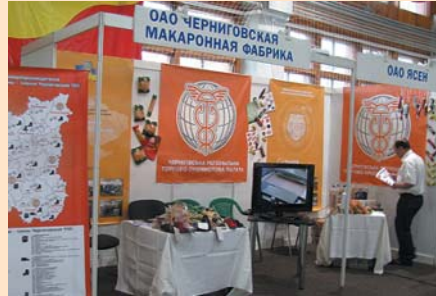
Колективний стенд Чернігівської ТПП на виставці «Весна в Гомелі 2009»