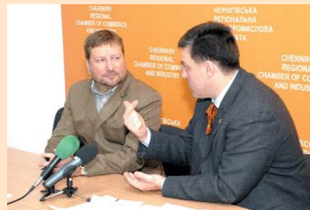
Зустріч з кандидатом в Президенти України Олегом Тягнибоком в Чернігівській ТПП

Не дочекавшись жодних відповідних дій з боку влади, робочою групою у складі 5 підприємств-експортерів було прийнято рішення про початок акції протесту. Метою акції було привернути увагу суспільства до проблем підприємств.