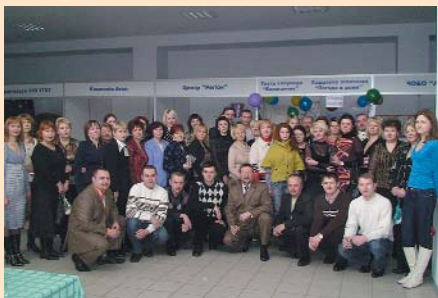
Під час святкового привітання жінок Чернігівської ТПП з Міжнародним жіночим днем