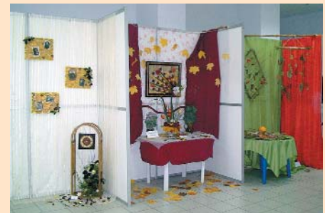
Конкурсні роботи учасників Дитячого обласного конкурсу фітодизайну «Осінні барви»