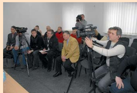
Представники регіональних ЗМІ на прес-конференції в ТПП