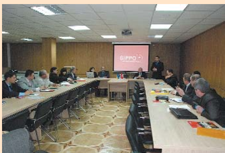
Презентація програми SIPPO членам Чернігівської ТПП