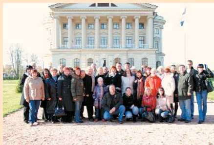
Екскурсія в Батури́нський історичний заповідник