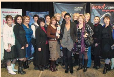
Ділові жінки Чернігівщини на майстер-класі Ірини Хакамади