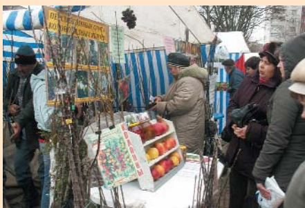
Виставка «Весна. Сад. Город»