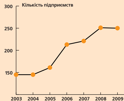
Динаміка росту членської бази

Серед регіональних торгово-промислових палат України Чернігівська ТПП займає 15 позицію за кількістю членів Палати. Згідно статуту ТПП України, члени регіональних ТПП є членами ТПП України, яких за результатами 2009 року налічується близько 9000 підприємств. Члени Чернігівської ТПП представляють усі галузі економіки області. Це — провідні підприємства деревообробного комплексу, легкої промисловості, приладобудування, харчової промисловості, фінансово-банківських установ, будівництва, торгівлі товарами та послугами тощо.