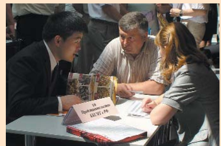
Під час переговорів на українсько-китайському форумі в ТПП України