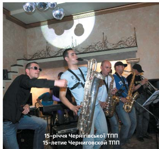
15-річчя Чернігівської ТПП 15-летие Черниговской ТПП