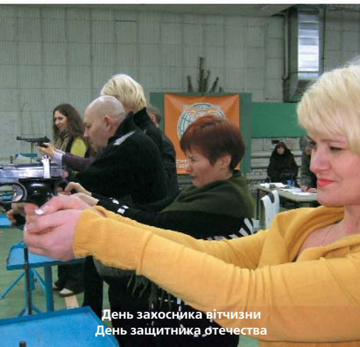
День захисника вітчизни День защитника отечества