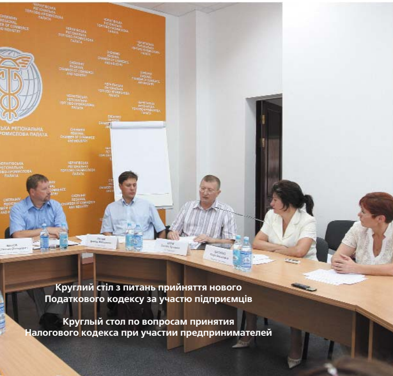
Круглий стіл з питань прийняття нового Податкового кодексу за участю підприємців