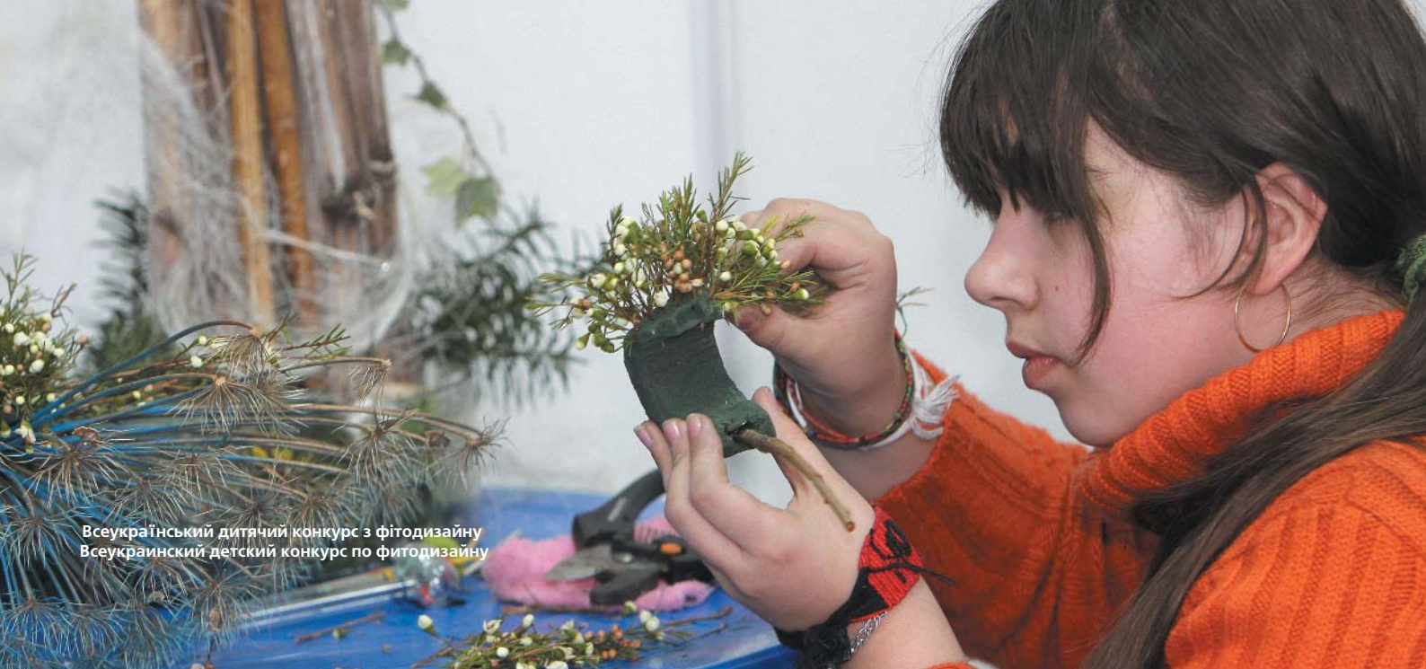
Всеукраїнський дитячий конкурс з фітодизайну Всеукраинский детский конкурс по фитодизайну