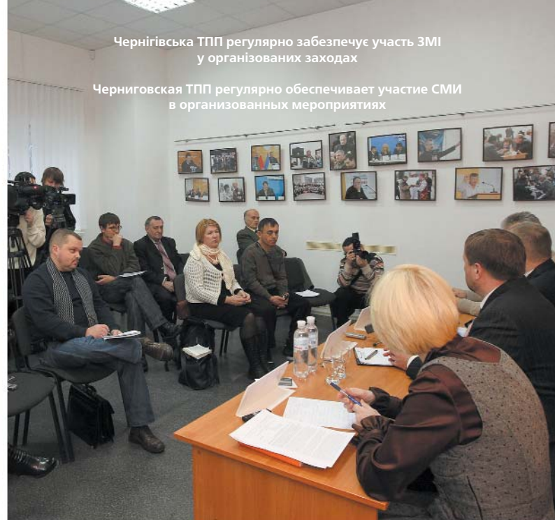
Чернігівська ТПП регулярно забезпечує участь ЗМІ у організованих заходах