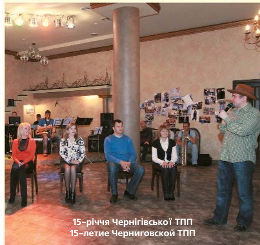
15-річчя Чернігівської ТПП 15-летие Черниговской ТПП