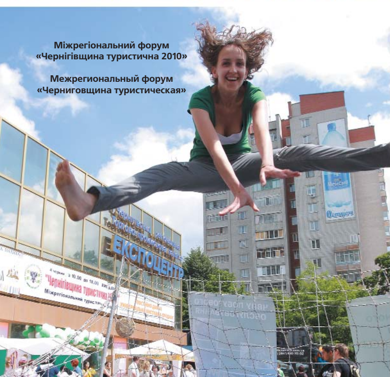
Міжрегіональний форум «Чернігівщина туристична 2010»