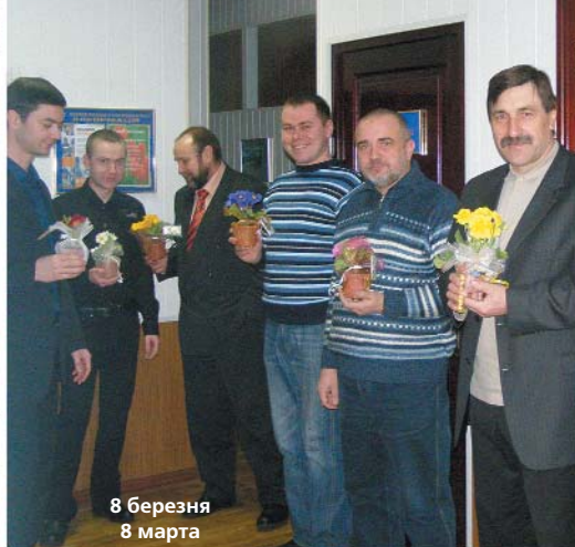
8 березня 8 марта