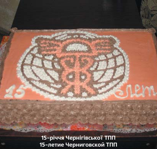
15-річчя Чернігівської ТПП 15-летие Черниговской ТПП