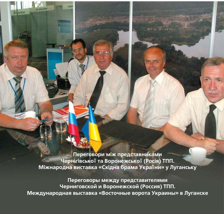
Переговори між представниками Чернігівської та Воронежської (Росія) ТПП. Міжнародна виставка «Східна брама України» у Луганську