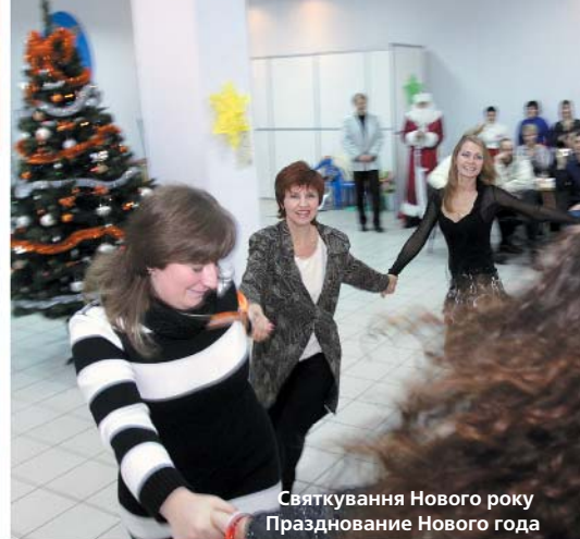
Святкування Нового року Празднование Нового года