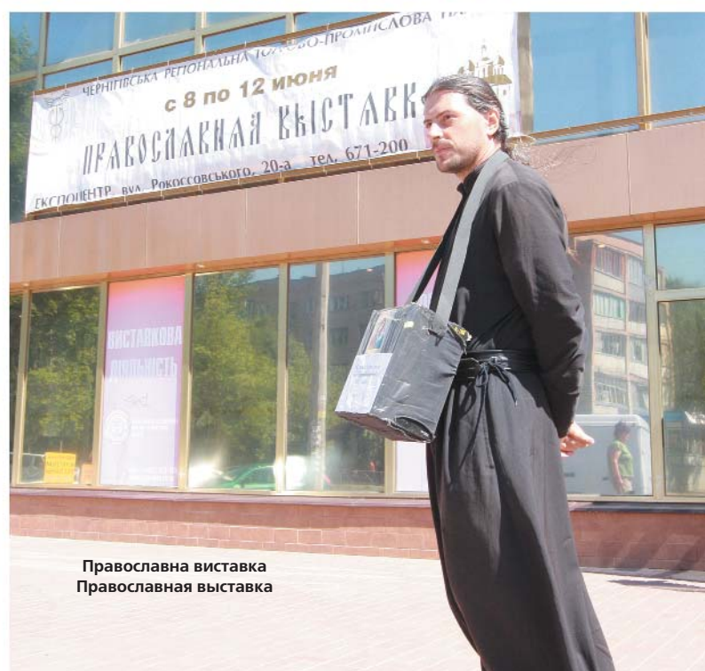
Православна виставка Православная выставка