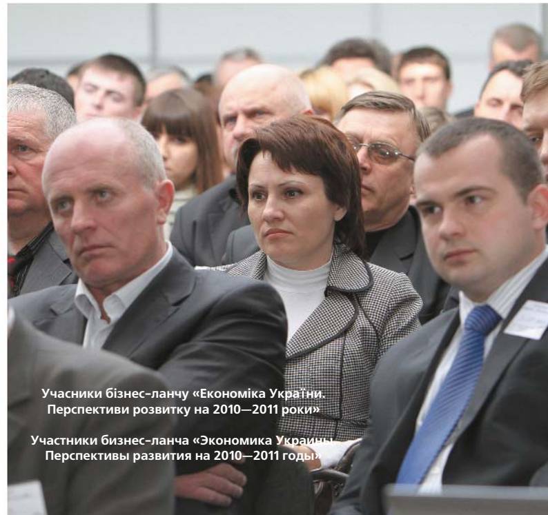
Учасники бізнес-ланчу «Економіка України. Перспективи розвитку на 2010—2011 роки»