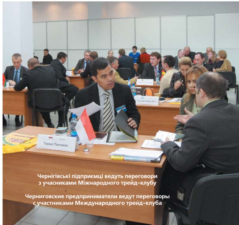
Чернігівські підприємці ведуть переговори з учасниками Міжнародного трейд-клубу