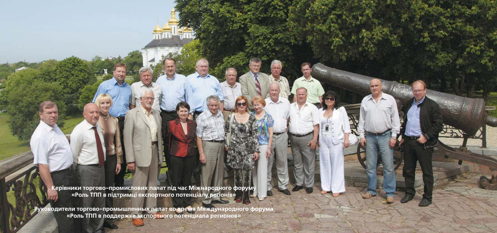
Керівники торгово-промислових палат під час Міжнародного форуму «Роль ТПП в підтримці експортного потенціалу регіонів»