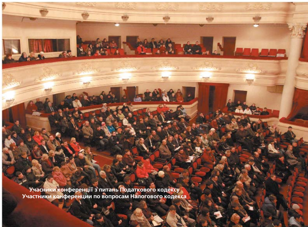
Учасники конференції з питань Податкового кодексу Учасники конференції по вопросам Налогового кодекса