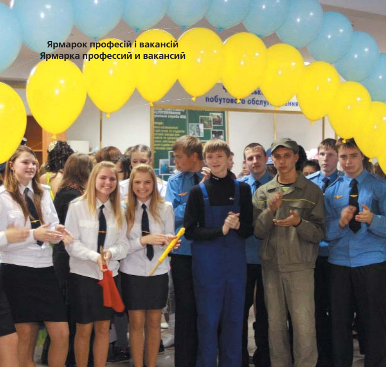
Ярмарок професій і вакансій Ярмарка професий и вакансий