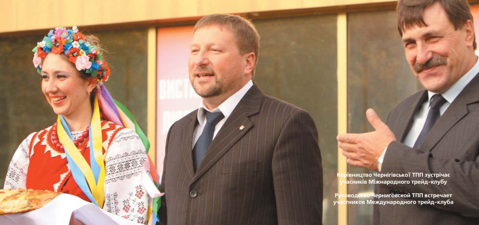
Керівництво Чернігівської ТПП зустрічає учасників Міжнародного трейд-клубу